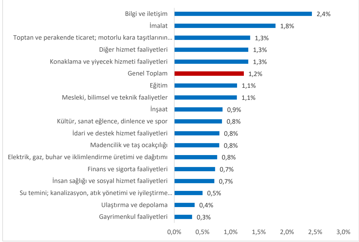
Şekil 1: Sektörler İtibariyle Açık İş Oranı (%) (1 ve Üzeri İstihdamlı İşyerleri)