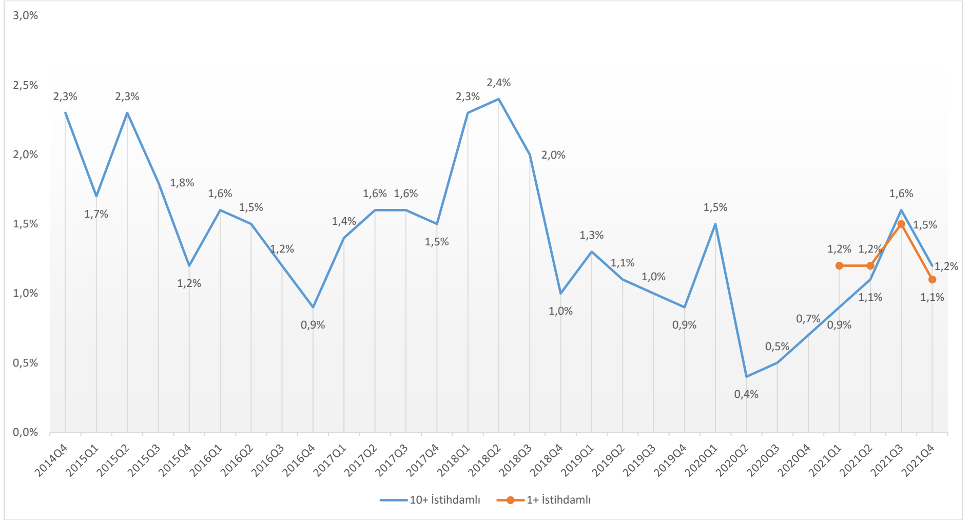
Şekil 2: Çeyreklikler İtibari ile Açık İş Oranları