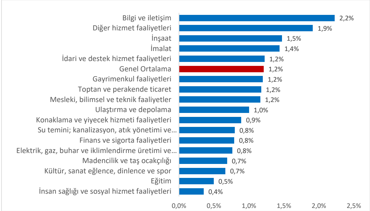
Şekil 1: Sektörler İtibariyle Açık İş Oranı (%) (1 ve Üzeri İstihdamlı İşyerleri)

Kaynak: 2021 Yılı 1. Çeyrek Açık İş İstatistikleri Araştırması, İŞKUR