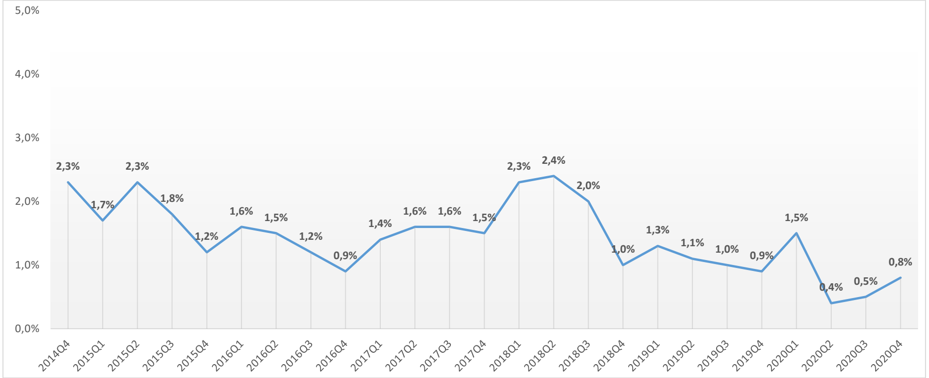
Şekil 2: Çeyreklikler İtibari ile Açık İş Oranları