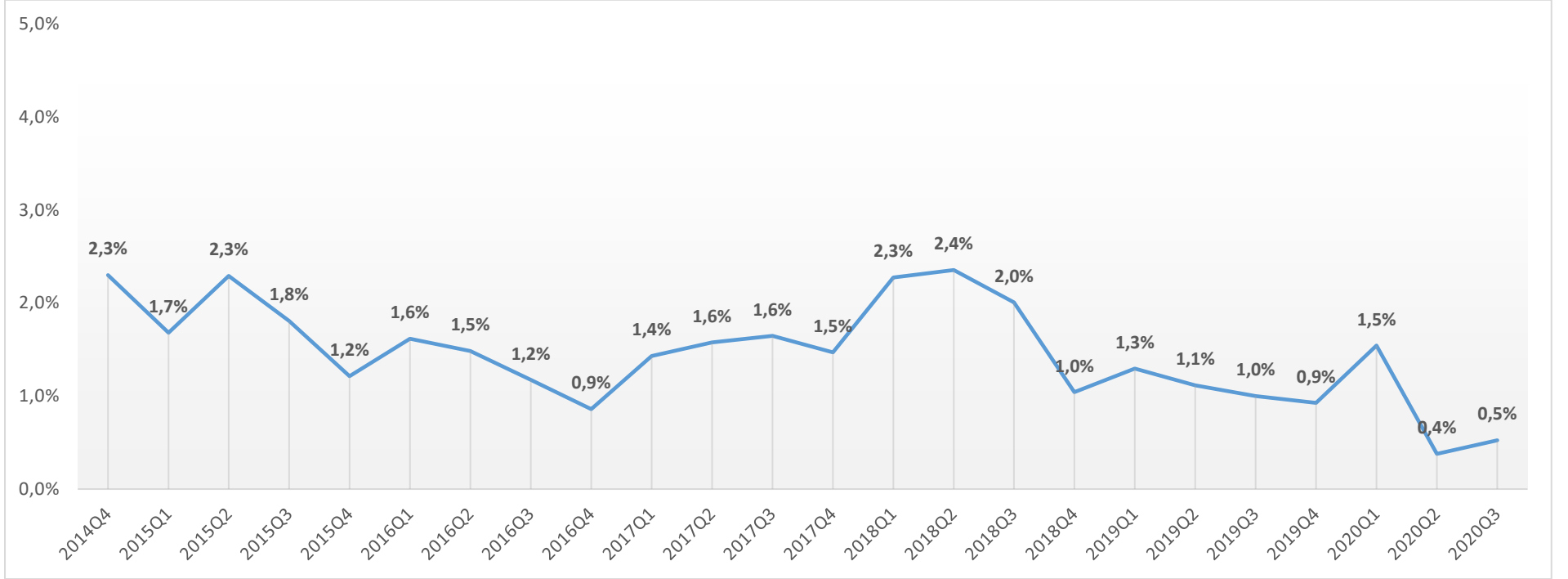
Şekil 2: Çeyreklikler İtibari ile Açık İş Oranları