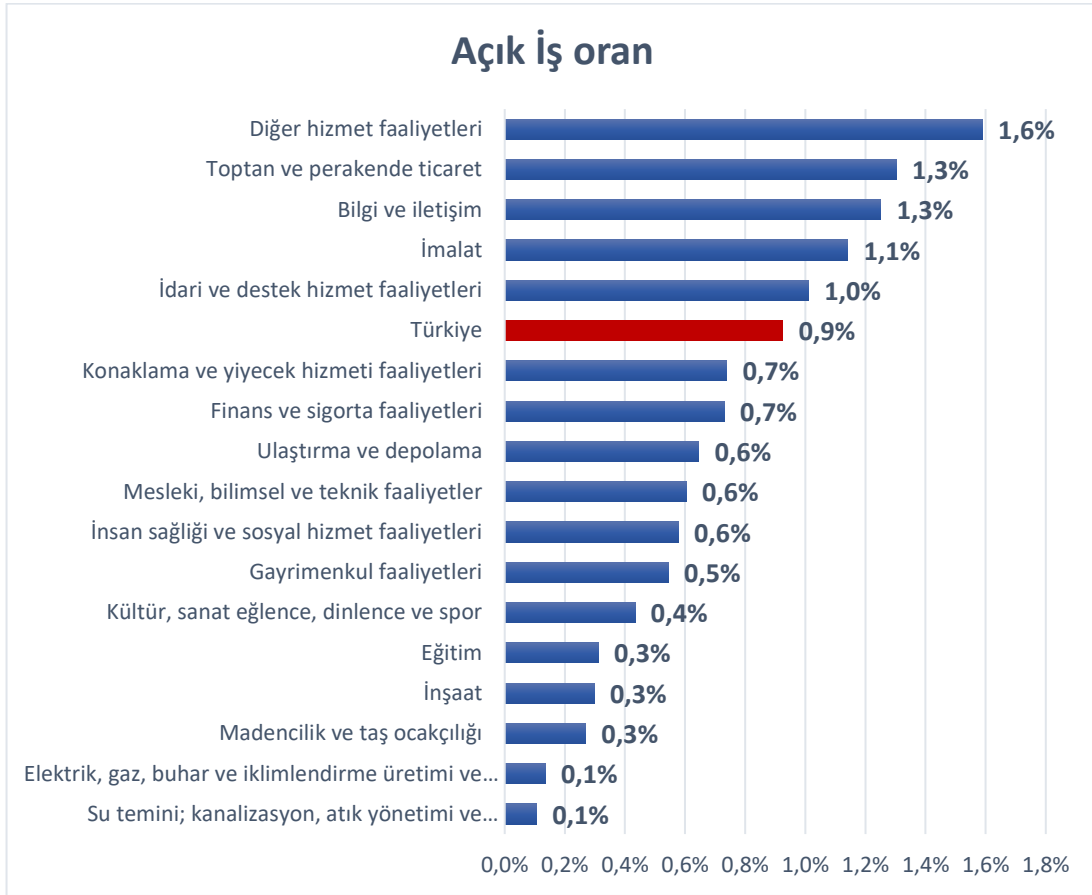
Şekil 1 Sektörler İtibariyle Açık İş Oranı(%)