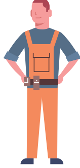
DİKİŞ MAKİNESİ OPERATÖRÜ