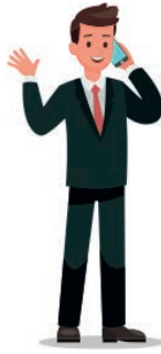
SATIŞ DANIŞMANI/ UZMANI