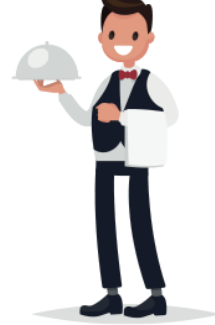
GARSON (SERVİS ELEMANI)