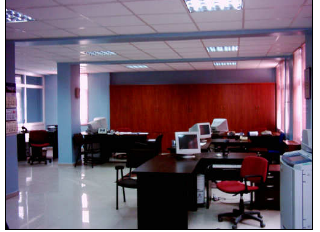
Gaziantep İl Müdürlüğü Hizmet Binası

Ayrıca, 20 model ofisimize, self servis hizmeti verebilmeleri amacı ile toplam 40 adet kioks kuruldu. Ankara, İstanbul, İzmir, Bursa ve Adana illerimizde görme özürlü vatandaşlarımıza hizmet vermek üzere ses ile yönlendiren yeni bilgisayarlar kuruldu. Kurumsal Dönüşüm Projesi (e-İŞKUR) kapsamında illerde hizmet veren sunucular kaldırılarak, tüm illerimizin merkezde ana server üzerinden hizmet vermesi sağlandı.