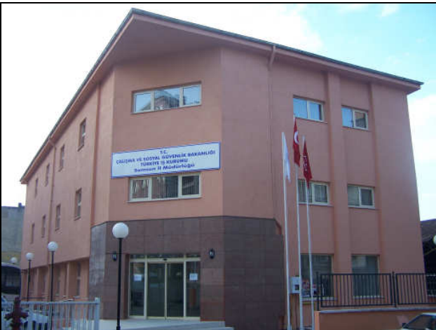
Samsun İl Müdürlüğü Hizmet Binası