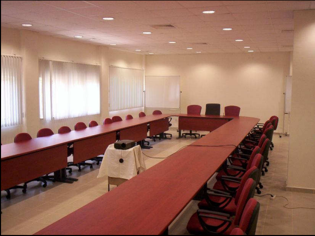
Antalya İl Müdürlüğü Hizmet Binası