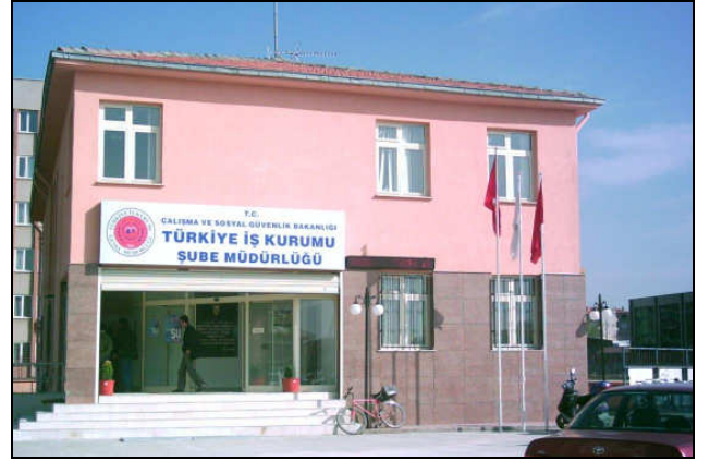
Gebze Şube Müdürlüğü Hizmet Binası