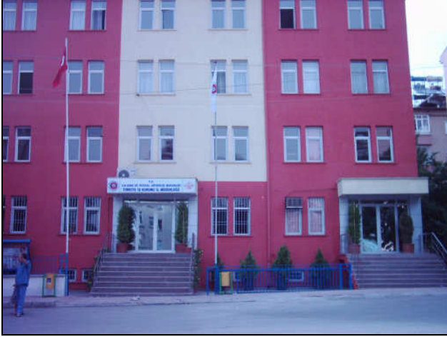
Gaziantep İl Müdürlüğü Hizmet Binası

Bu çerçevede 81 il müdürlüğümüze note-book, projeksiyon cihazı ve 150 adet lazer yazıcı dağıtıldı.