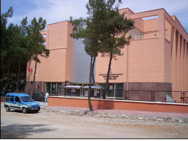
Antalya İl Müdürlüğü Hizmet Binası