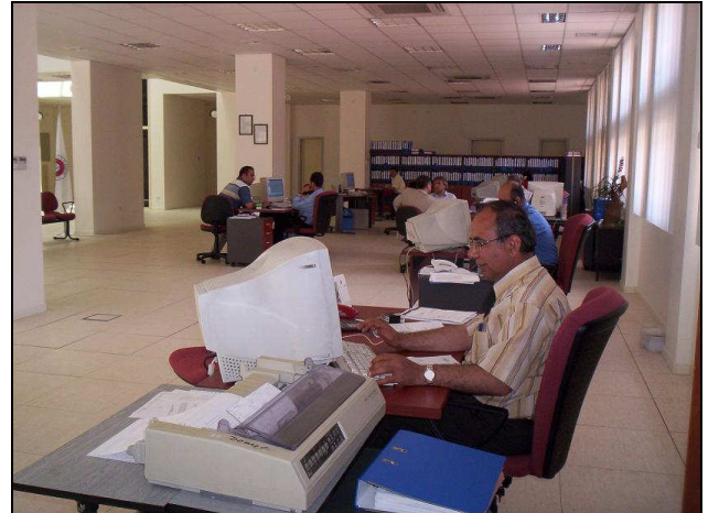
Antalya İl Müdürlüğü Hizmet Binası