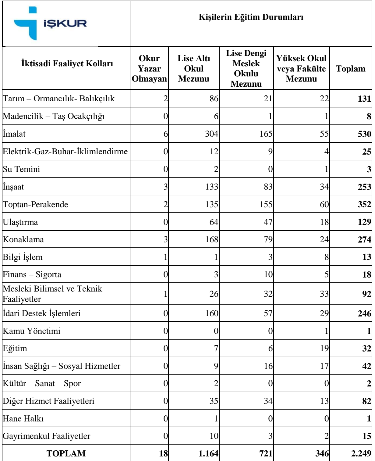
Tablo 11: İşsizlik Sigortasından Yararlananların İktisadi Faaliyet Kolları ve Eğitim Durumlarına Göre Sayısı

Tablo Yorumu: İşsizlik sigortasından faydalananların İktisadi Faaliyet Kolları ve Eğitim durumlarına göre dağılımına bakılarak oluşturulan tabloda Lise Altı Okul Mezunu ve Lise Dengi-Meslek Okulu mezunlarının yoğunlukta olduğu görülmektedir. Meslek bazında ise en fazla yoğunluğun sırası ile İmalat – Toptan Perakende ve Konaklama sektörlerinde olduğu göze çarpmaktadır. Yılısonu itibariyle toplam İÖ başvurumuz 4.978 kişi olup, İÖ hak kazanan vatandaşlarımıza İşsizlik Sigortası kapsamında toplamda 12.122.603 TL ödeme yapılmıştır.